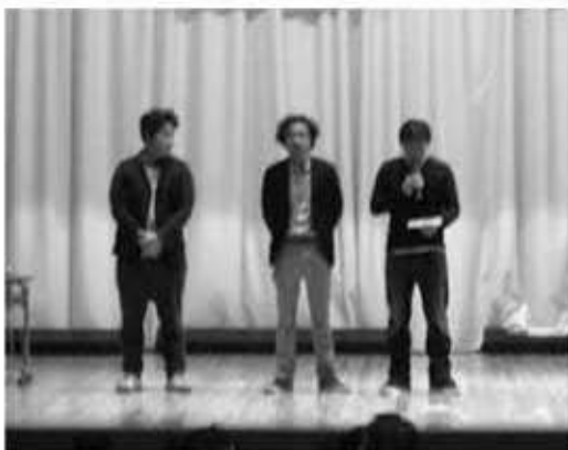
大会スローガンを唱和する生産者代表3名