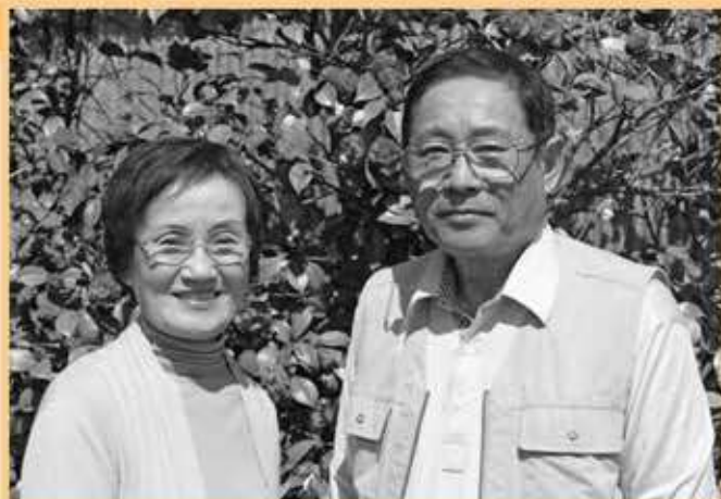
pension a partner