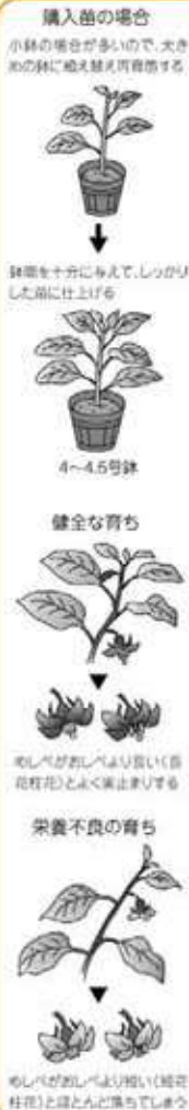
購入苗の場合 小鉢の場合が多いので、大きめの鉢に植え替え可能です。

7月下旬には思い切つて枝を切り詰め更新剪定（せんでい）し、株の周りに堆肥や肥料を施し、おいしい秋ナス取りも狙いましょう。