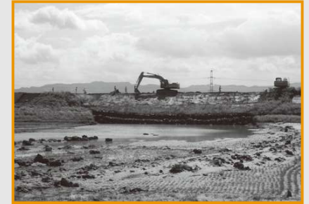
復旧を急ぐ矢部川堤防