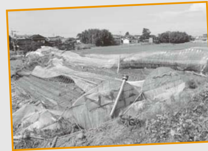
中山地区の被害を受けたハウス