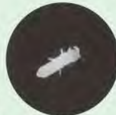
写真1 体長2~3mmのシロトビムシ類

シロトビムシ類(写真1)は体長2~3mmで、年に1回発生します。シロトビムシ類は土の中に生息し、地表下20~40cmの所につくった巣の中に潜んで夏を越し、秋になると地表近くに移動し、春にかけて有機物や農作物の幼芽、幼根を加害します。加害された農作物は発芽不良や生育抑制を引き起こします。