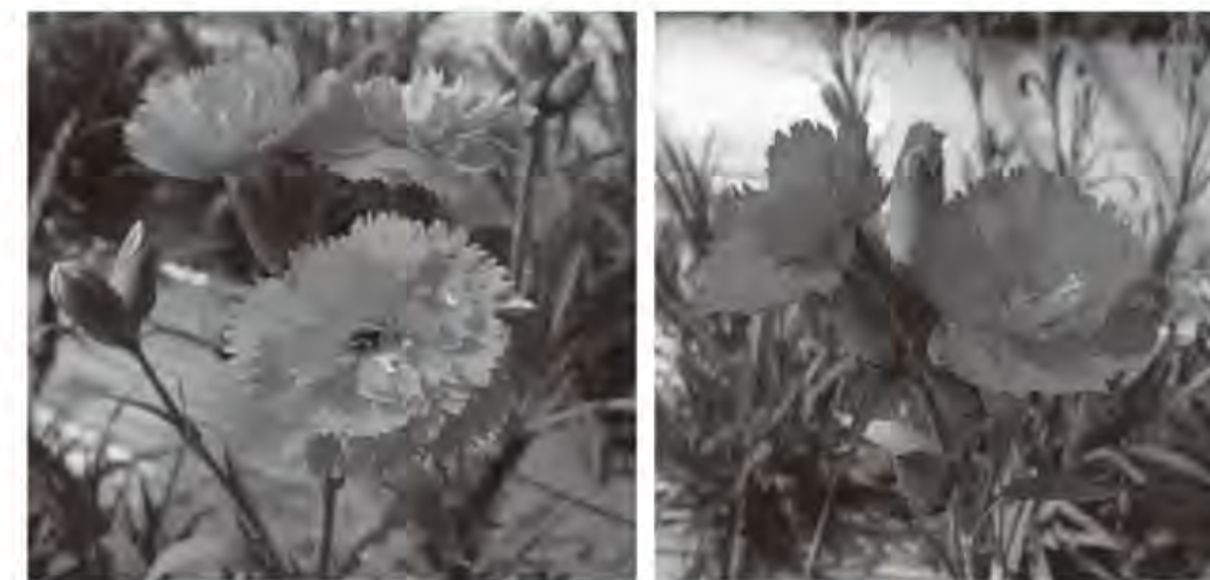
ピンキーカジュアル

「ダイアンサス」とは、切花用のナデシコのことです。 赤紫色の「紫香の舞」、淡いピンクの「ピンキーカジュアル」は、カーネーション×ナデシコの交配で生まれた、福岡県オリジナル品種です。 手がからないことと、切り花本数が多く採れることが特徴です。