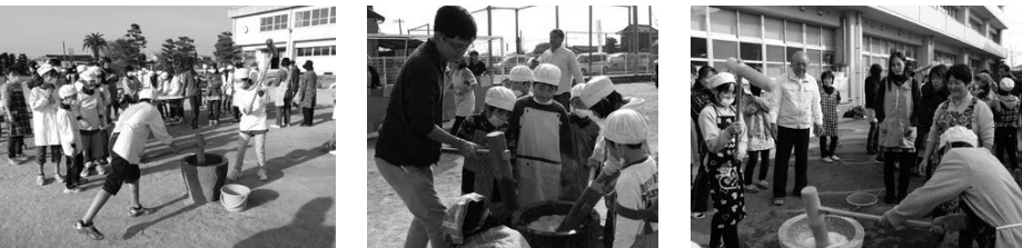
柳川市立昭代第一小学校 (11月24日)