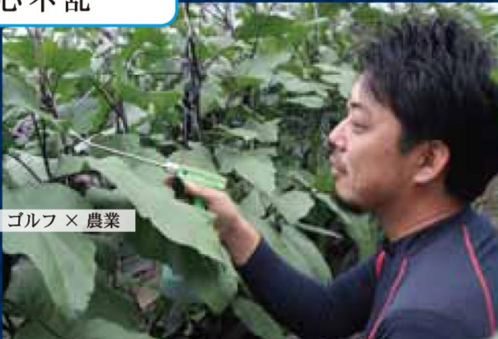
充実 = ゴルフ × 農業