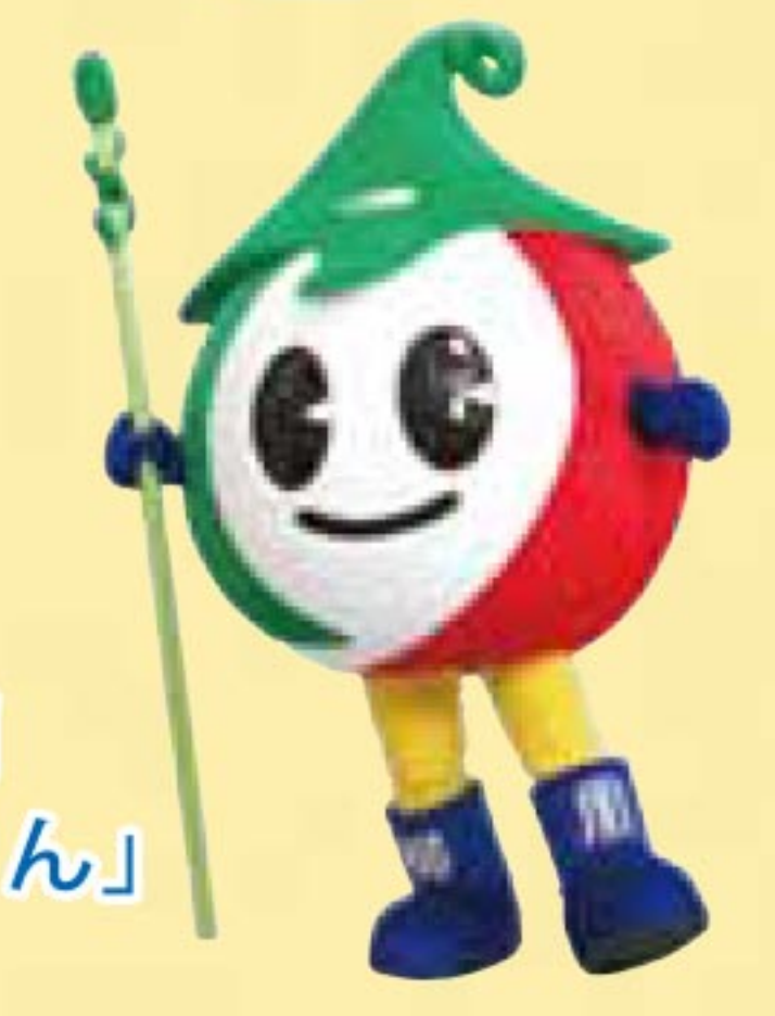
JA柳川 「 SENDOKUN 」