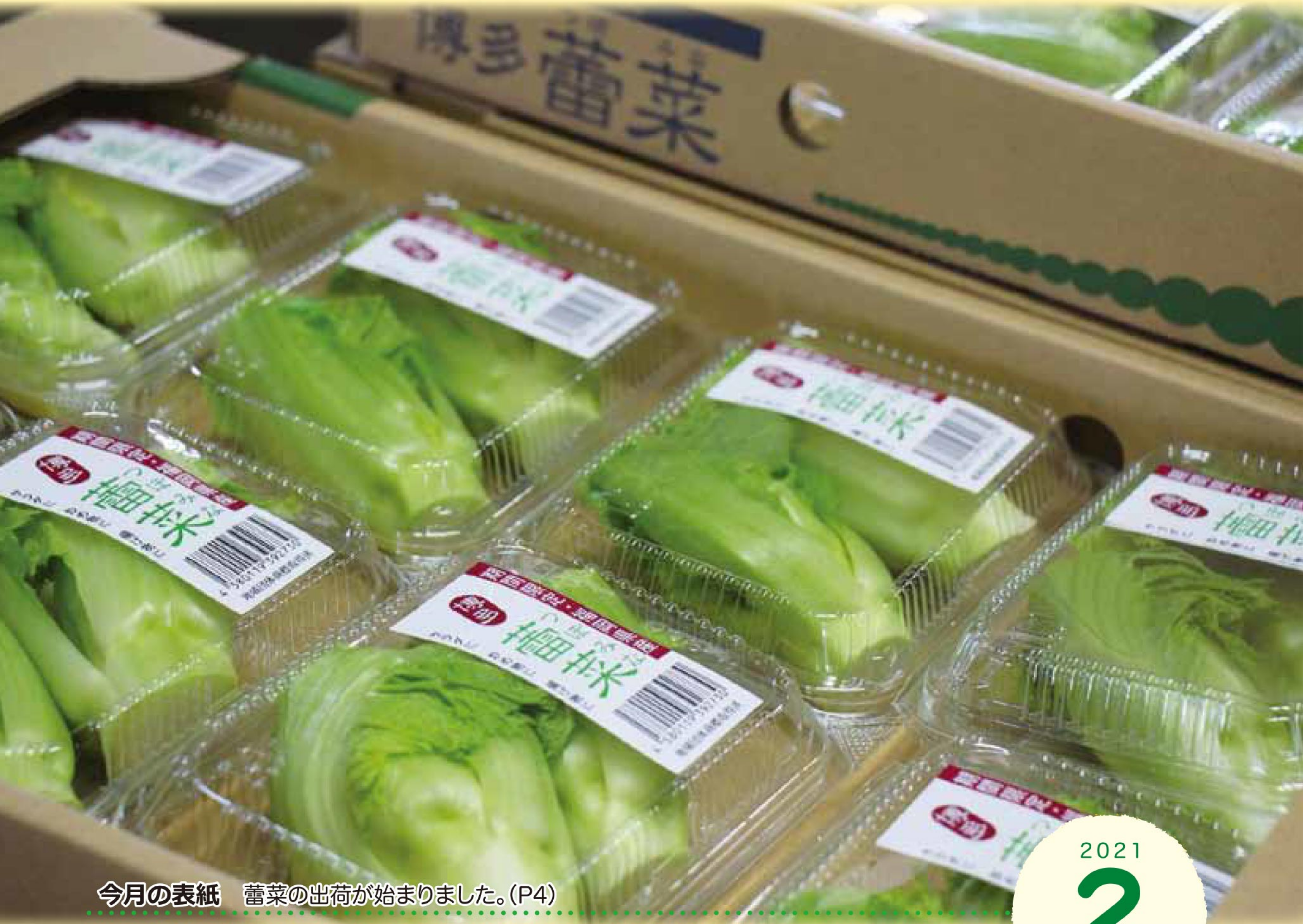
今月の表紙 蕾菜の出荷が始まりました。(P4)