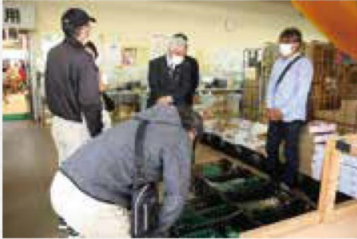
直売所のバックヤードを視察