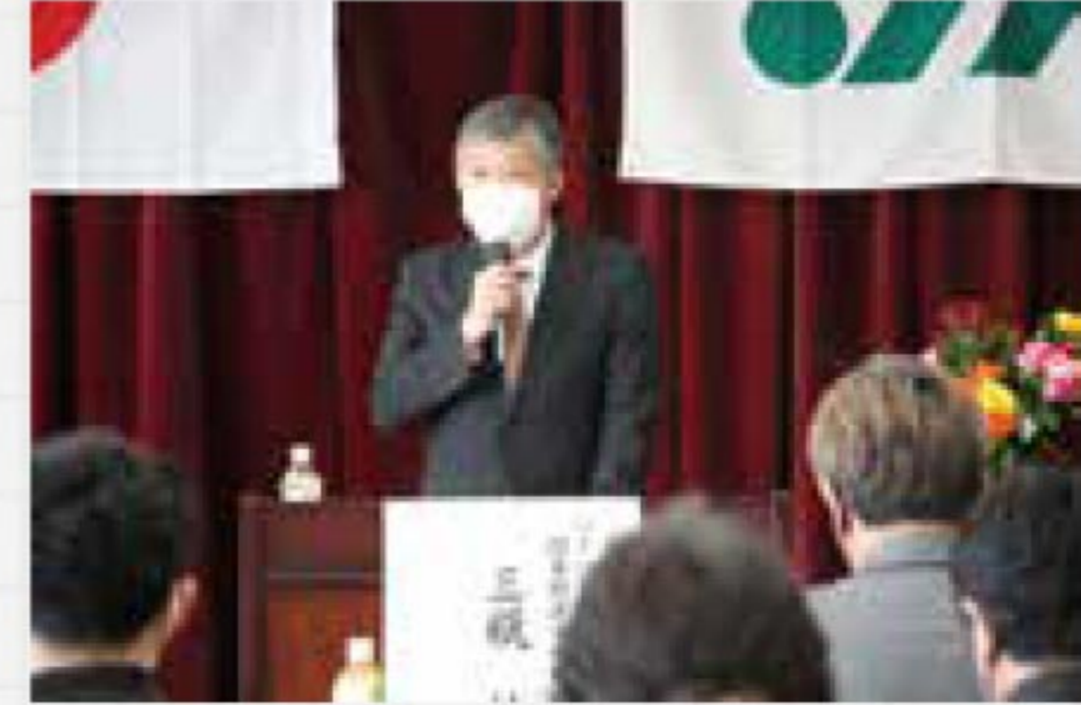
組合員教育先進 JA による基調講演