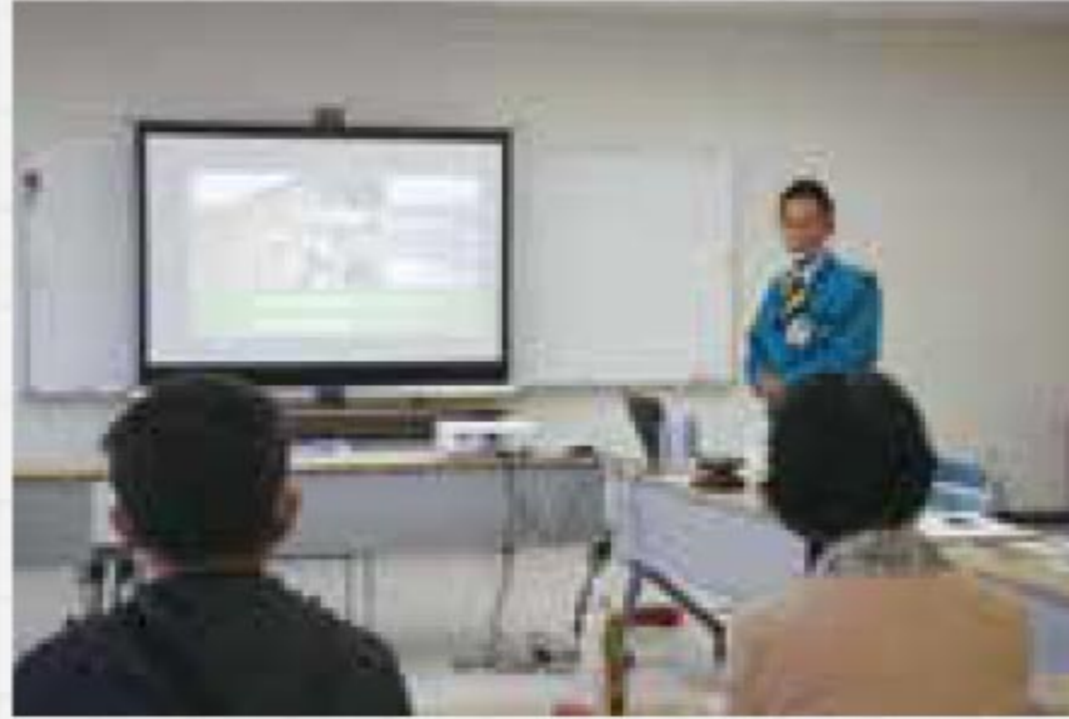
講義を受ける受講生