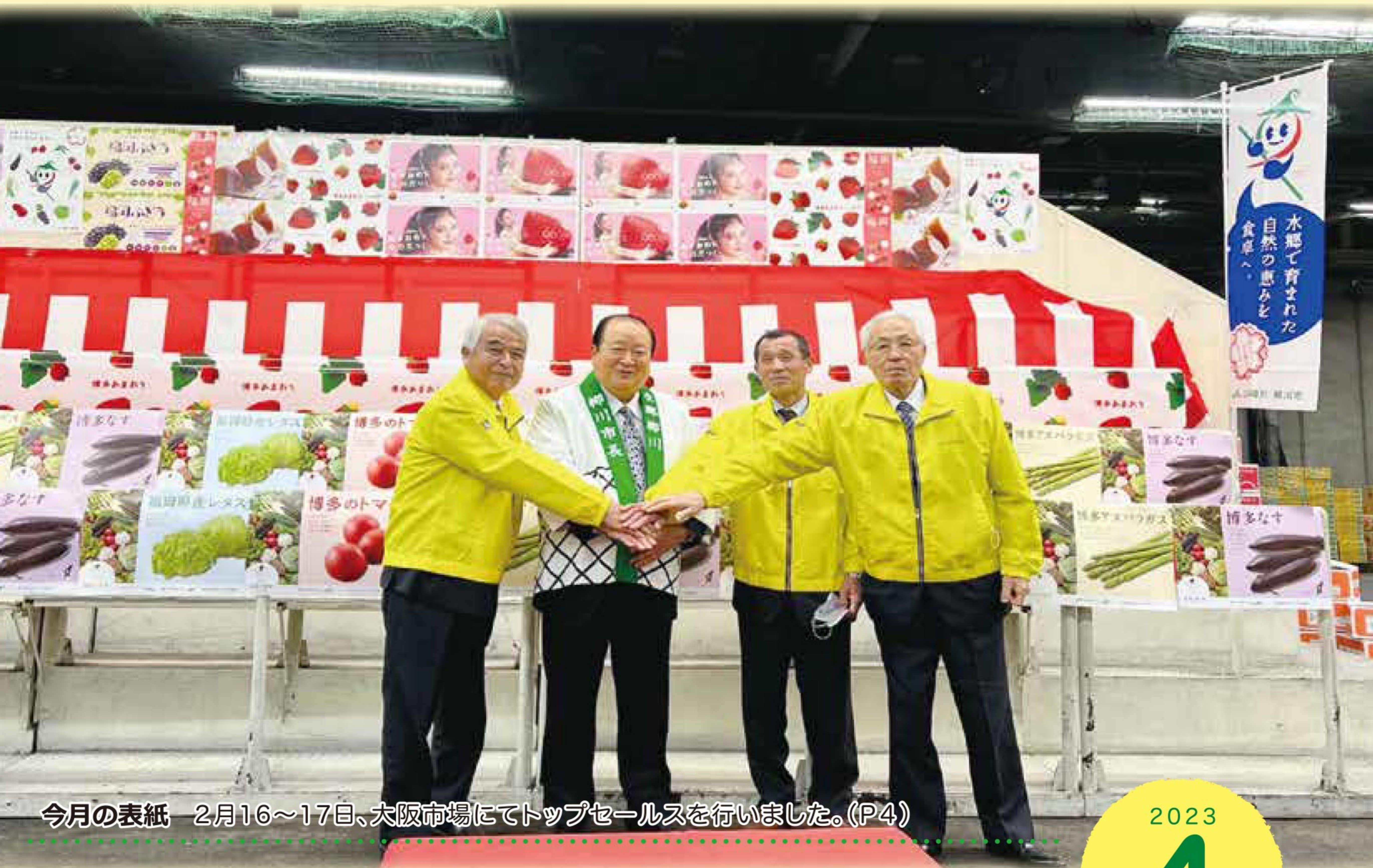
今月の表紙 2月16~17日、大阪市場にてトップセールスを行いました。(P4)