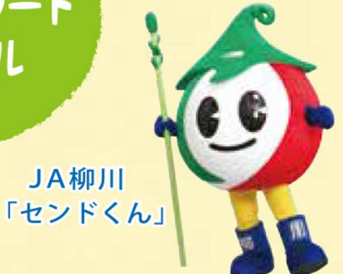
JA柳川「 SENDOKUN 」