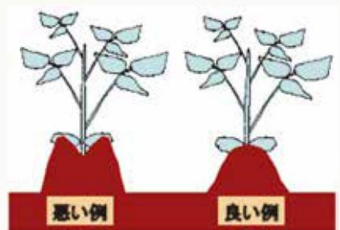
培土における株元への土寄せ方法

一方、開花期は大豆の生育に最も水分が必要な時期です。梅雨明け後、天気予報でしばらく降雨が無く、土壌が乾きすぎる場合は、降雨があるまで本暗きよの栓を閉めるなどして土壌水分の維持に努め、乾燥害を防ぎます。