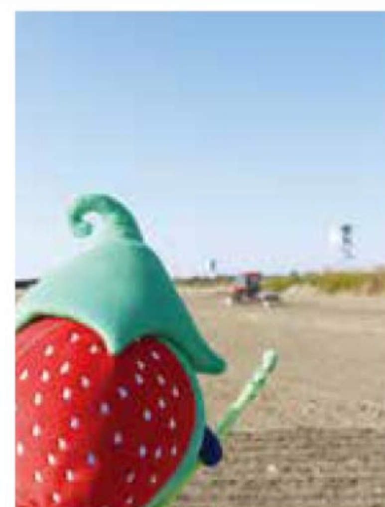
麦の種まき 11月26日投稿