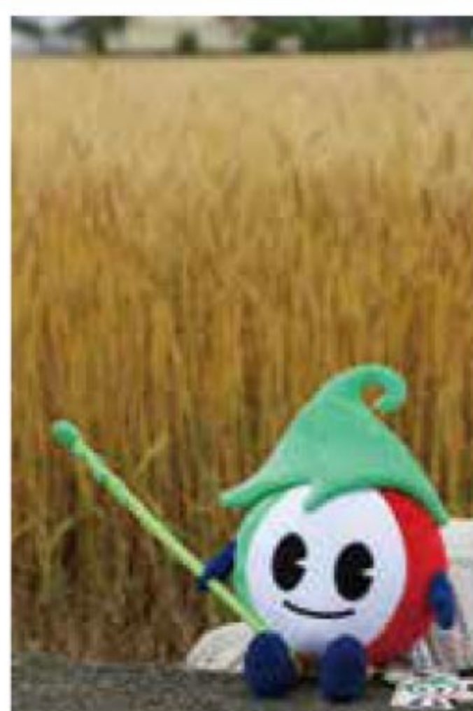
センドくんぬいぐるみ初登場 5月26日投稿