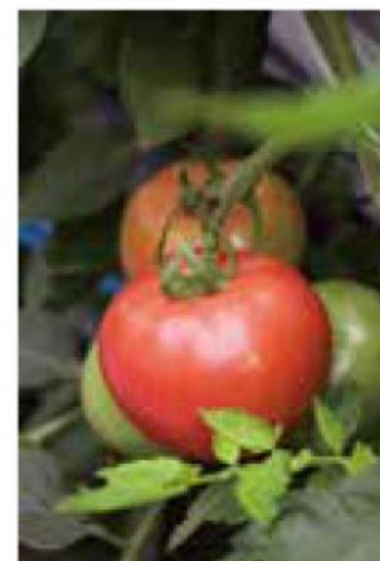
旬の味!トマト 12月24日投稿