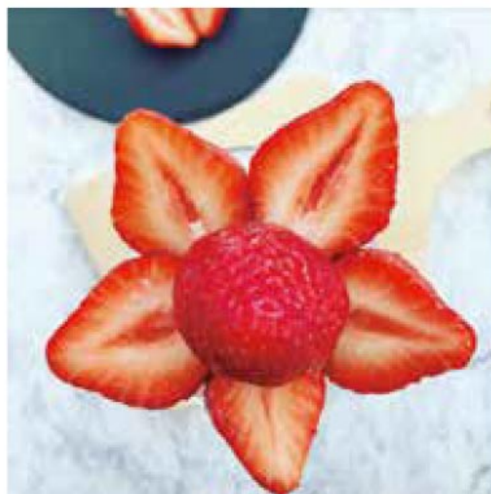
いちごパフェ 2月26日投稿