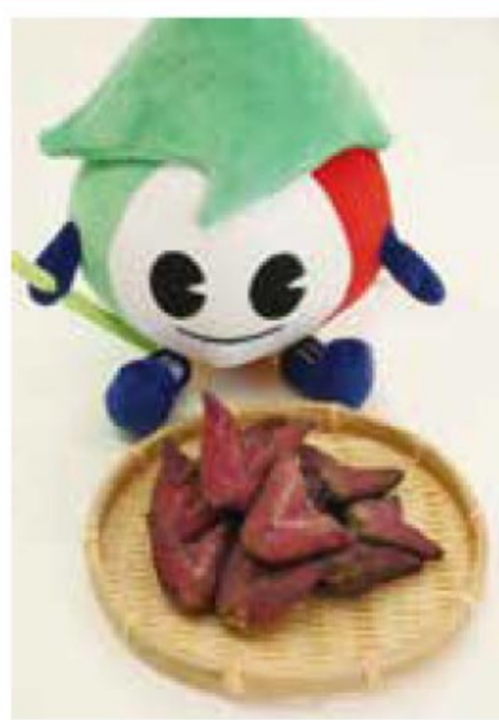
ヒシの出荷が始まりました 9月30日投稿