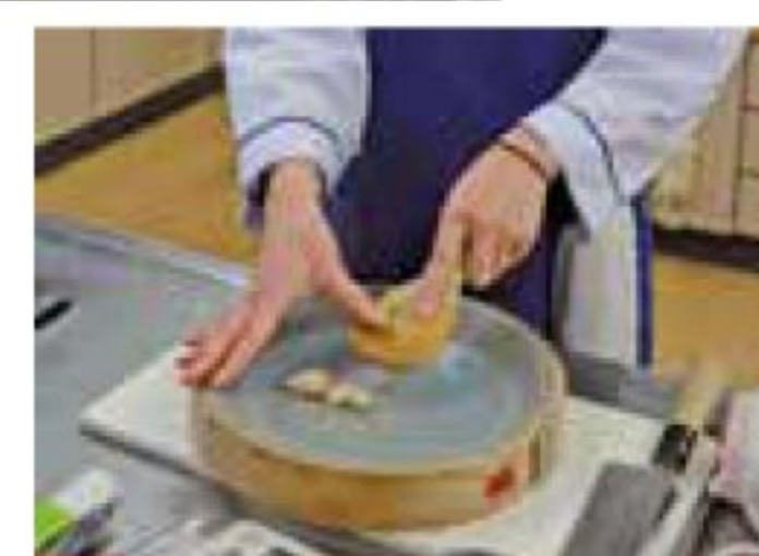
第1回高校生レシピコンテスト 2月7日投稿