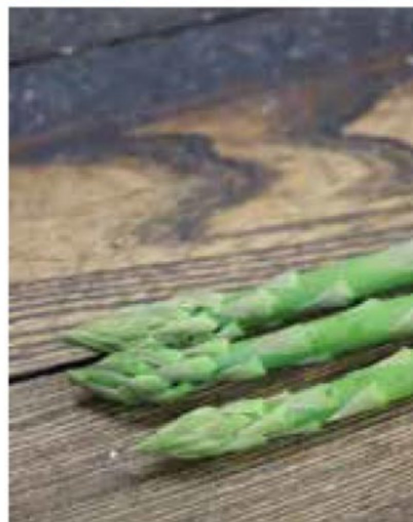
アスパラガスの出荷が始まりました 1月17日投稿