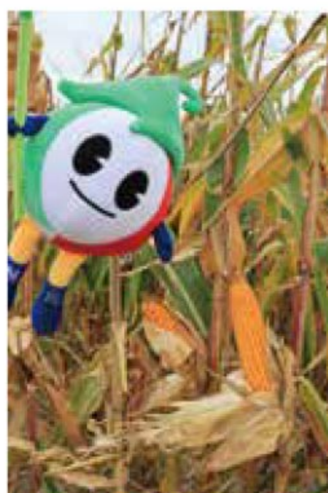
夏播き! 子実用とうもろこし収穫 11月9日投稿