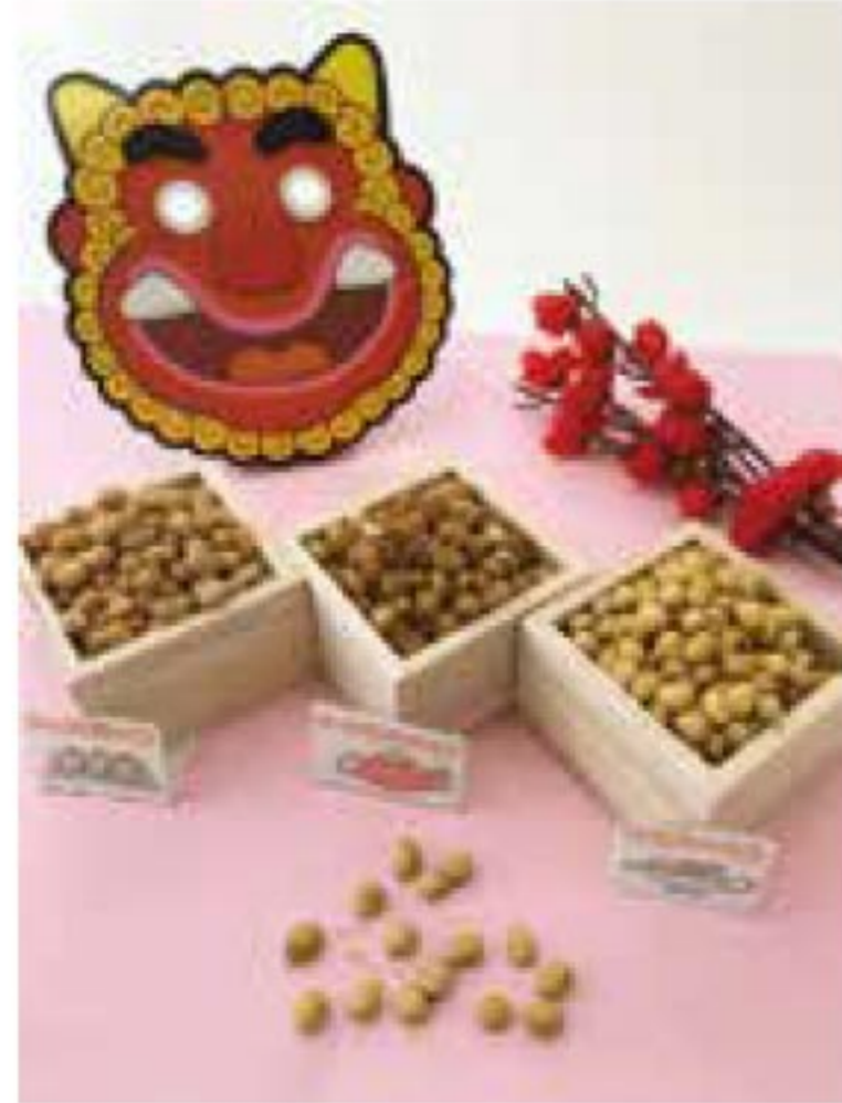
節分〜『だいず3兄弟』 2月2日投稿