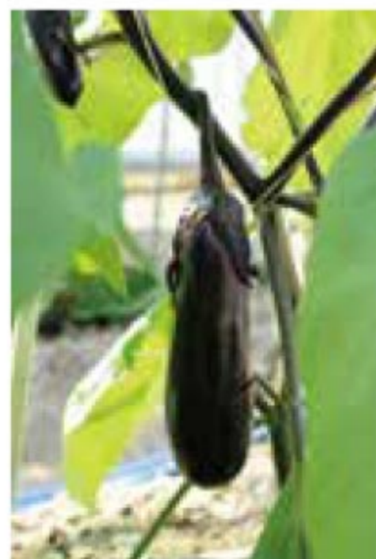
旬の味!なす 9月30日投稿