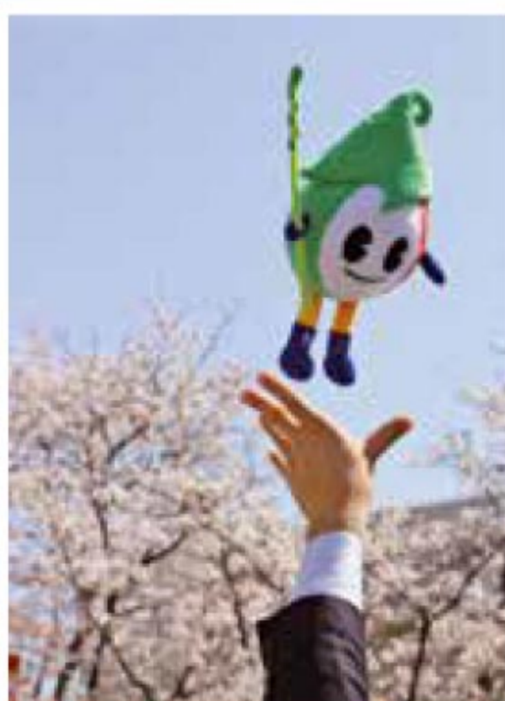
花びより✽桜 3月30日投稿