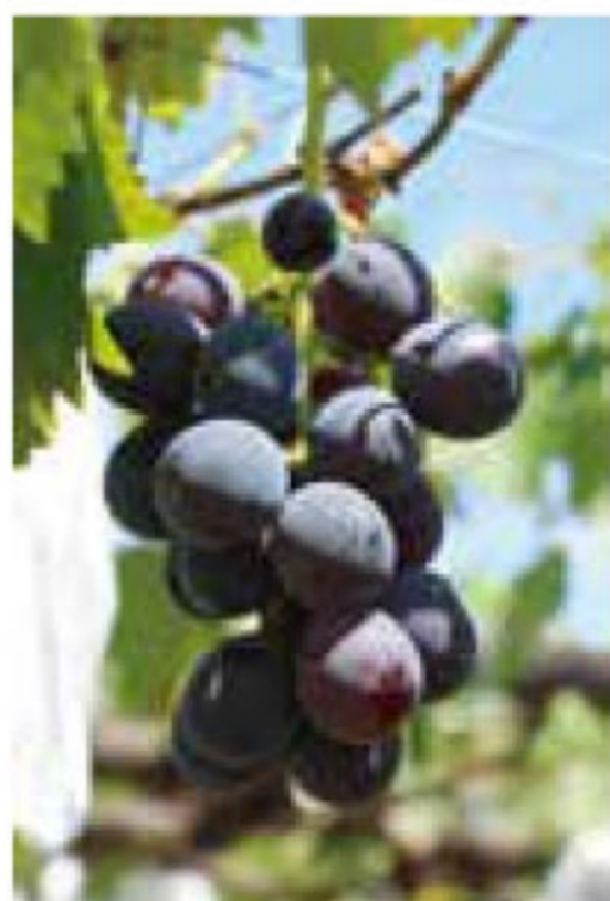
旬の味!ぶどう「巨峰」 8月13日投稿