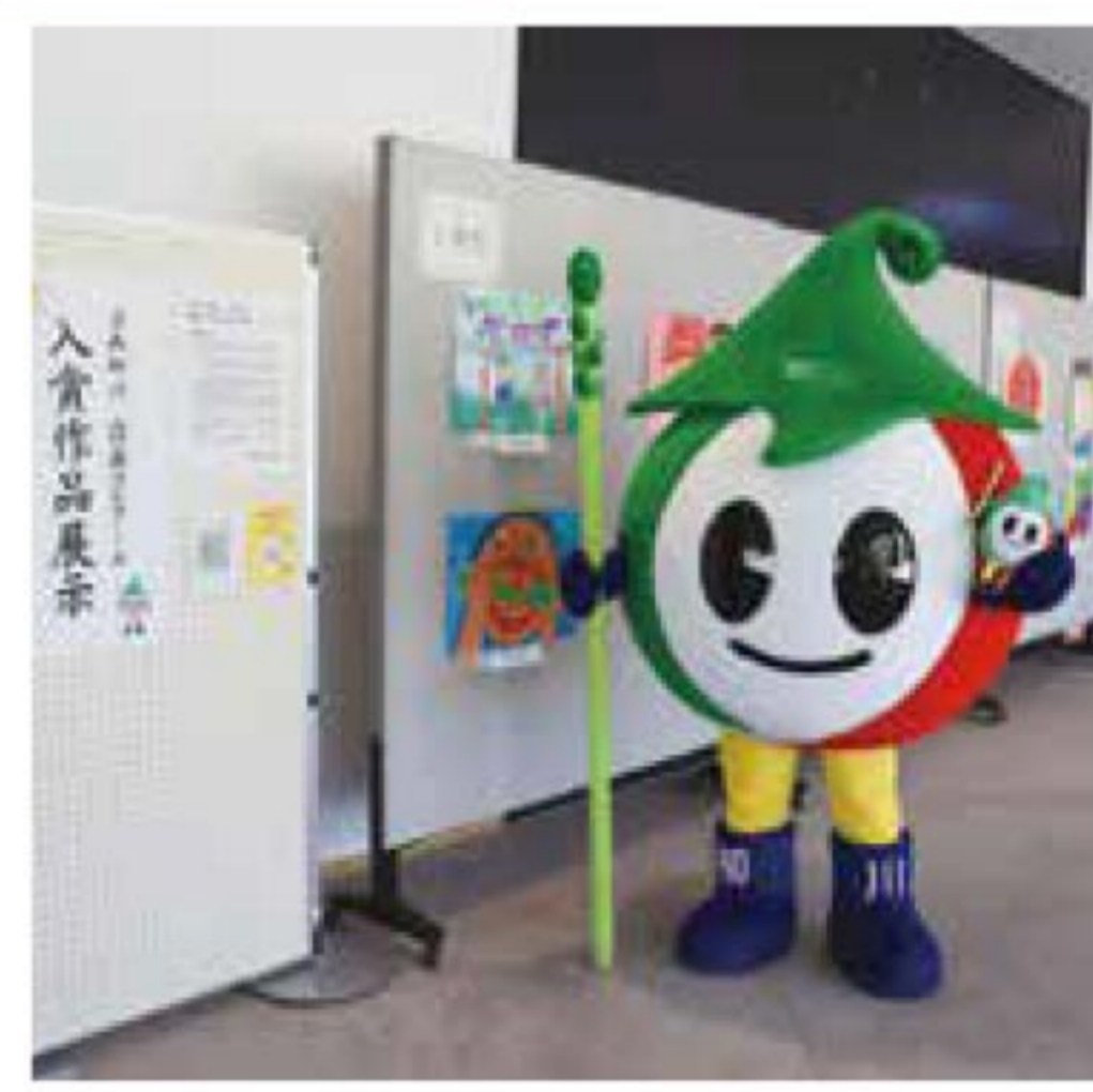
第16回図画コンクール 表彰式 10月14日投稿