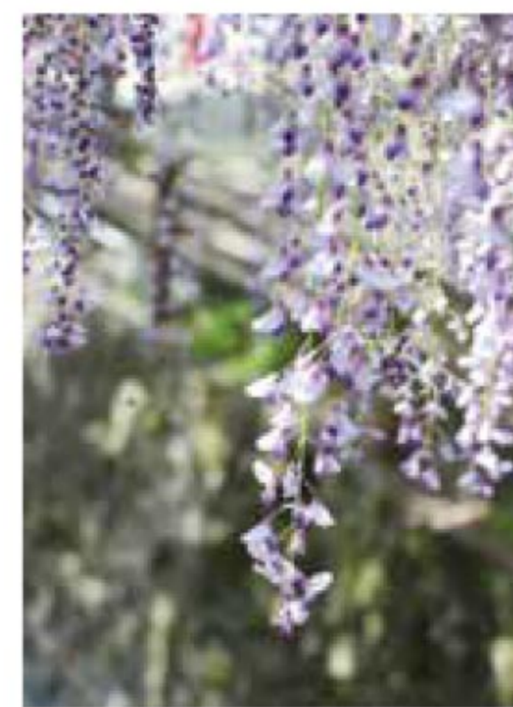
管内の“四季”をご紹介します「中山の大フジ」 4月21日投稿