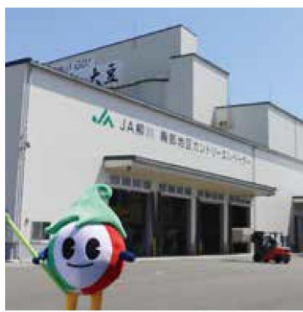
南部地区カントリーエレベーター 6月8日投稿