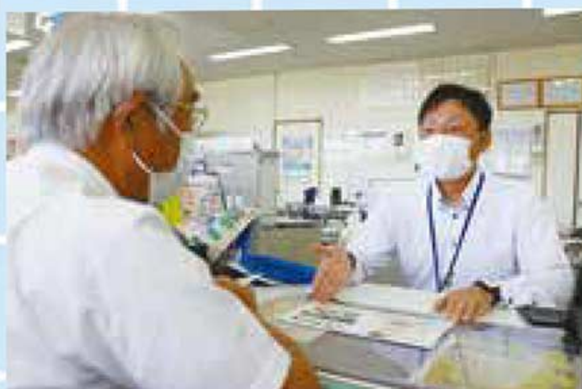
分かりやすくご説明します。