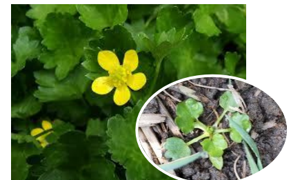
〈キンポウゲ類(トゲミキネボウ類)〉

4 月頃に黄色の花が咲く。秋から発生し、春には草丈が 50～60 cm 程度になる。