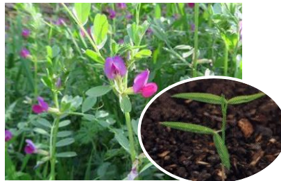
〈カラスノエンドウ〉

タデ科の植物。12 月下旬から 2 月下旬頃まで発生する。細長い双葉と赤い茎が目印。